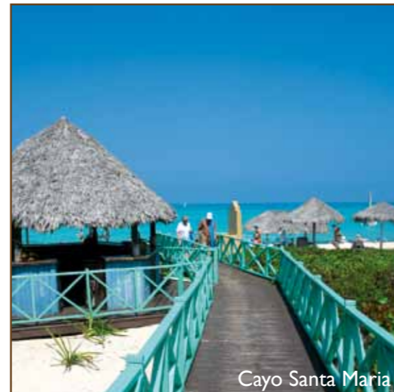
Cayo Santa Maria