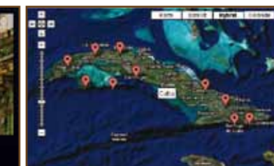
Google-Maps / Karten