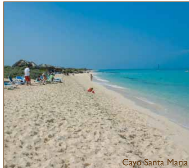
Cayo Santa Maria